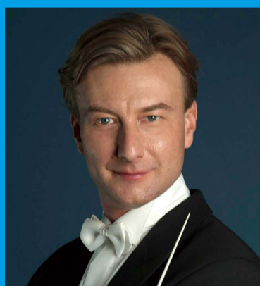
クリスティアン・アルミンク (指揮) Christian Arming (Dirigent)

7. Sep. Suntory Hall, Tokyo 11. Sep. Suntory Hall, Tokyo Information: http://www.suntory.com/sfa/music/summer/2017/outline.html#theme