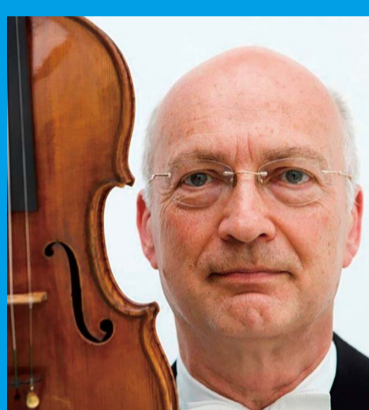
ライナー・キュッヒル (ヴァイオリン) Rainer Küchl (Violine)

1. Jul. Bunkamura Orchard Hall, Tokyo Information: https://www.njp.or.jp/archives/1131