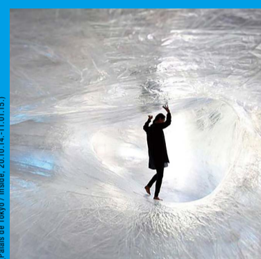
ヌーメン/フォー・ユース 「そこまでやるか 壮大なプロジェクト」展 Numen/For Use „GRAND PROJECTS: HOW FAR WILL YOU GO?“