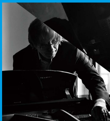
ゲオルク・フリードリヒ・ハース (作曲) Georg Friedrich Haas (Komponist)

10. Aug. Karuizawa Ohga Hall Information: Karuizawa Hibikinokai Tel. 080-2015-1226