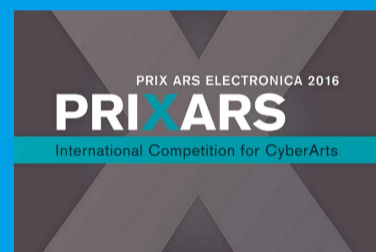
アルス・エレクトロニカ・アニメーション・ フェスティバル 2016 入選作上映会 Screening of Ars Electronica Animation Festival 2016